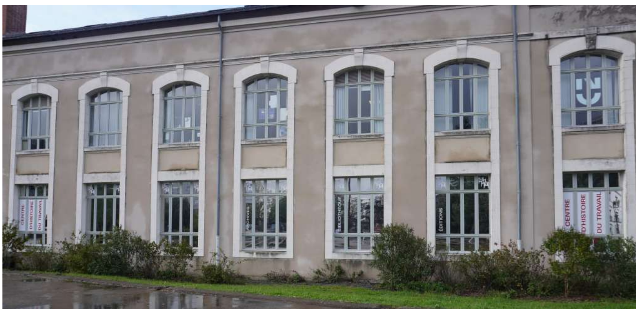
Vue de la façade sud du bâtiment Ateliers et Chantiers de Nantes où se trouve le CHT, avec la nouvelle vitrophanie.

Le 20 octobre, nous avons participé à la journée qu'organisaient le Centre réseau du SUDOC-PS, Mobilis et les membres du comité de pilotage du plan de conservation partagée des périodiques à la BU Belle-Beille d'Angers. Au programme : plusieurs ateliers permettant de mieux gérer les collections de périodiques (conservation, dons...), ainsi qu'une visite du Centre des archives du féminisme.