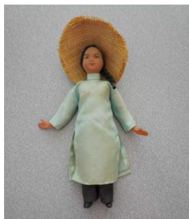
Poupée vietnamienne vendue par la revue Antoinette en soutien au Vietnam, 1973. Fonds UD CGT 44.

des mobilisations et du mouvement ouvrier autant que de contribuer très directement à la réflexion sur les pratiques professionnelles et privées d'archivage et de valorisation des objets. Ainsi, la démarche permet de renouveler l'étude des pratiques militantes et des mouvements sociaux en s'intéressant à la matérialité de ces pratiques, à la place qu'y occupent la conception ou la circulation des objets, et aux éventuels débats que celles-ci suscitent au sein des mobilisations ou des organisations. L'objectif du projet est aussi d'articuler ces interrogations historiques et sociologiques avec les enjeux archivistiques et patrimoniaux, à la fois comme questions de recherche et comme défi concret pour les professionnel-le-s des institutions qui accueillent les archives et les objets envisagés.