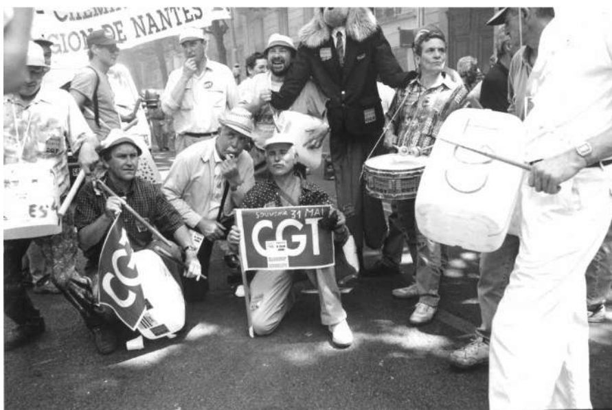
Manifestation à Paris, 31 mai 1995.