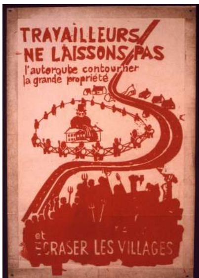
Affiche, 1972.