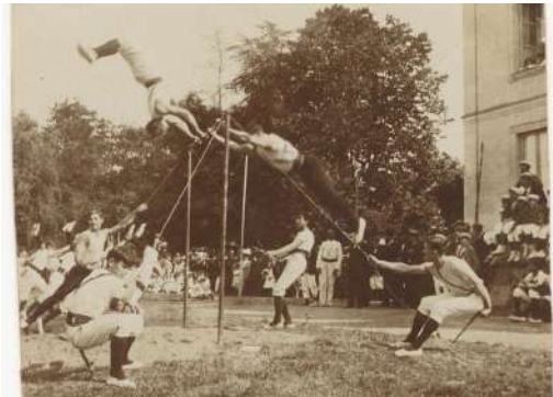
L'Union sportive montagnarde (USM), années 1920-1930.

Une nouvelle exposition a été élaborée à partir d'une des thématiques nationales des Journées du patrimoine : le patrimoine des sports. Cette exposition de photographies issues exclusivement des fonds du CHT met en lumière certains aspects politiques du sport au XX e siècle en lien avec les classes populaires. À travers ces photos, le sport se révèle au croisement de divers enjeux de pouvoir dont s'emparent l'Église catholique, le patronat paternaliste mais aussi les militants eux-mêmes. Accrochée pour les JEP, elle fût visible tout l'automne dans le couloir du CHT et sera raccrochée en mars 2024 après le départ de l'exposition « Portraits de France ».