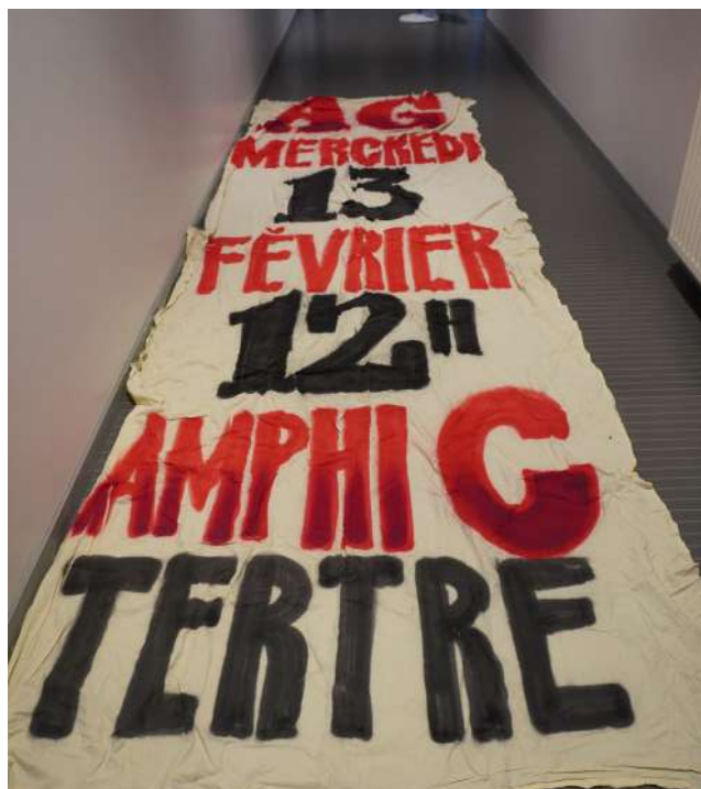
Mobilisation à l'université de Nantes en février 2013. Fonds Syndicat des étudiants de Nantes.

téristiques. En s'inspirant du modèle de Service des musées de France et en l'adaptant aux particularités du projet (possibilité de recenser des exemplaires du même objet conservé par des institutions différentes, de documenter l'existence d'objets pour lesquels aucun lieu de conservation physique n'a été repéré, etc.), un modèle de description des objets militants a été élaboré en utilisant le logiciel de base de données relationnelles Heurist.