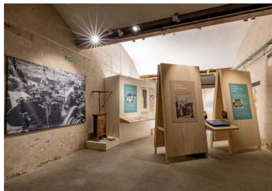
Vue de l'exposition « L'entreprise Turpault, une saga choletaise » (Cholet)