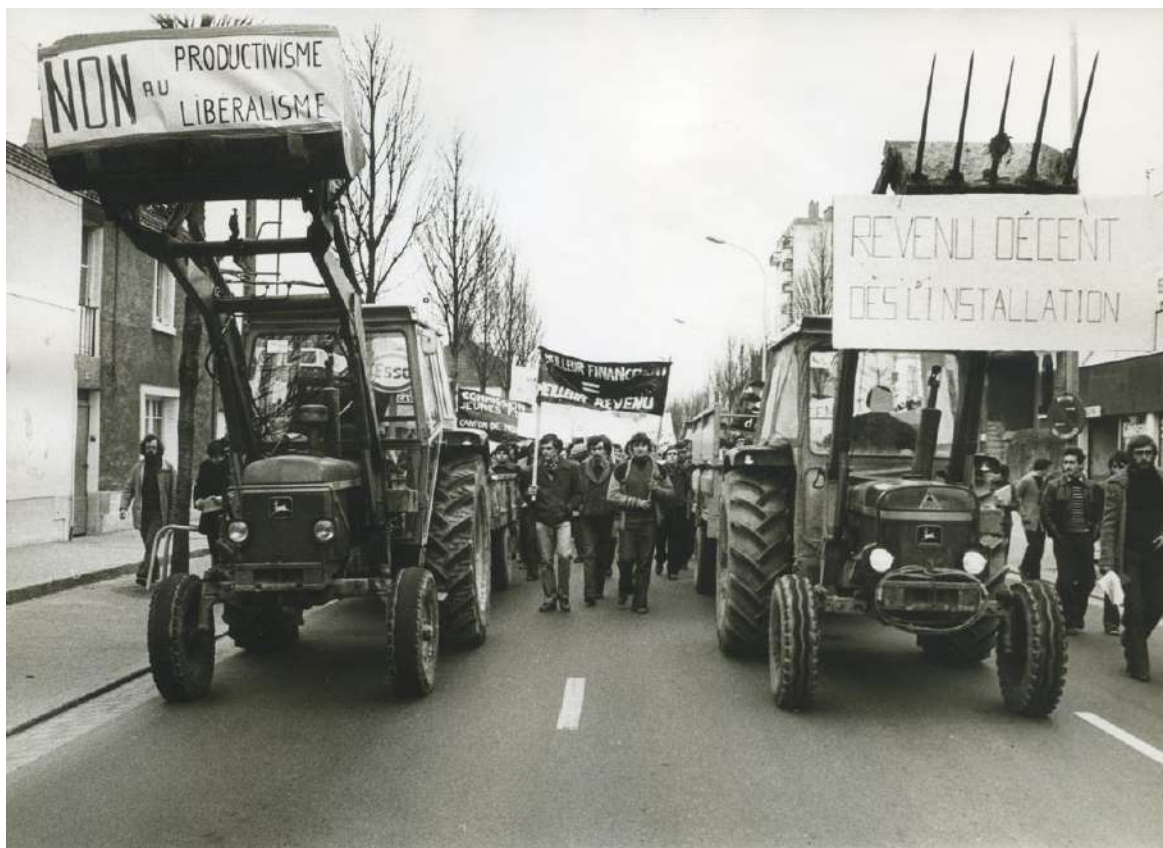
Manifestation paysanne, Guémené-Penfao, 22 mars 1980.