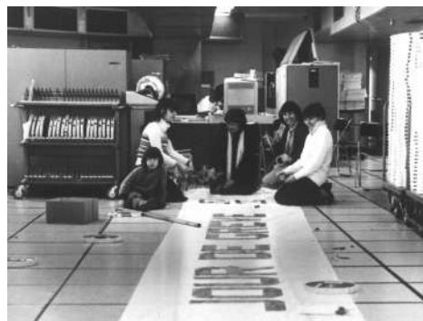
Grève de 1980-1981.

Le résultat de cette recherche prendra la forme, en 2024, d'un cours dispensé à l'Université permanente et d'une conférence aux archives départementales.