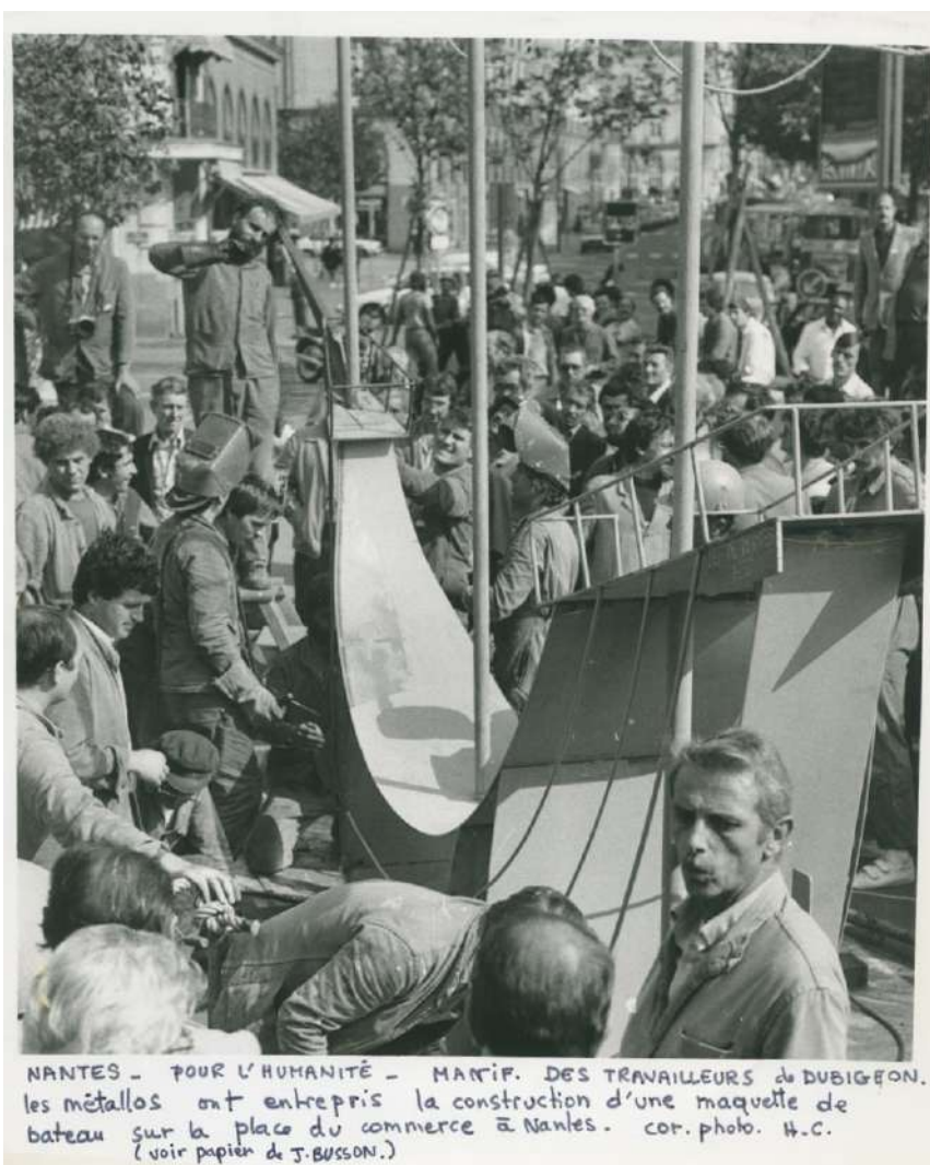
Nantes, 30 septembre 1983. Fonds Hélène Cayeux, photo Hélène Cayeux.

Centre d'histoire du travail Association loi 1901 SIRET 322 258 971 00025 www.cht-nantes.org