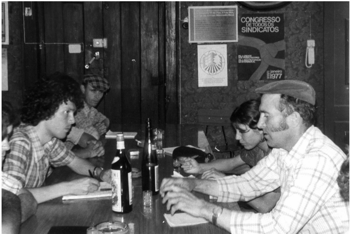
Jeunes agriculteurs de la FDSEA lors d'un séminaire au Portugal, juillet 1979 CHT, 2 FDSEA 42

Classement réalisé par HUMEAU Maxime, stagiaire archiviste sous la direction de NOYER Manuella